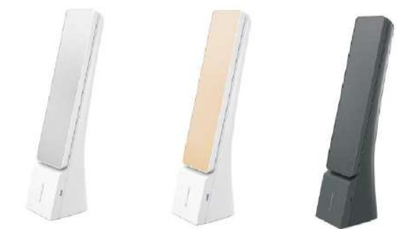
Matt Silver/ White Matt Gold/ White Matt Black/ Black